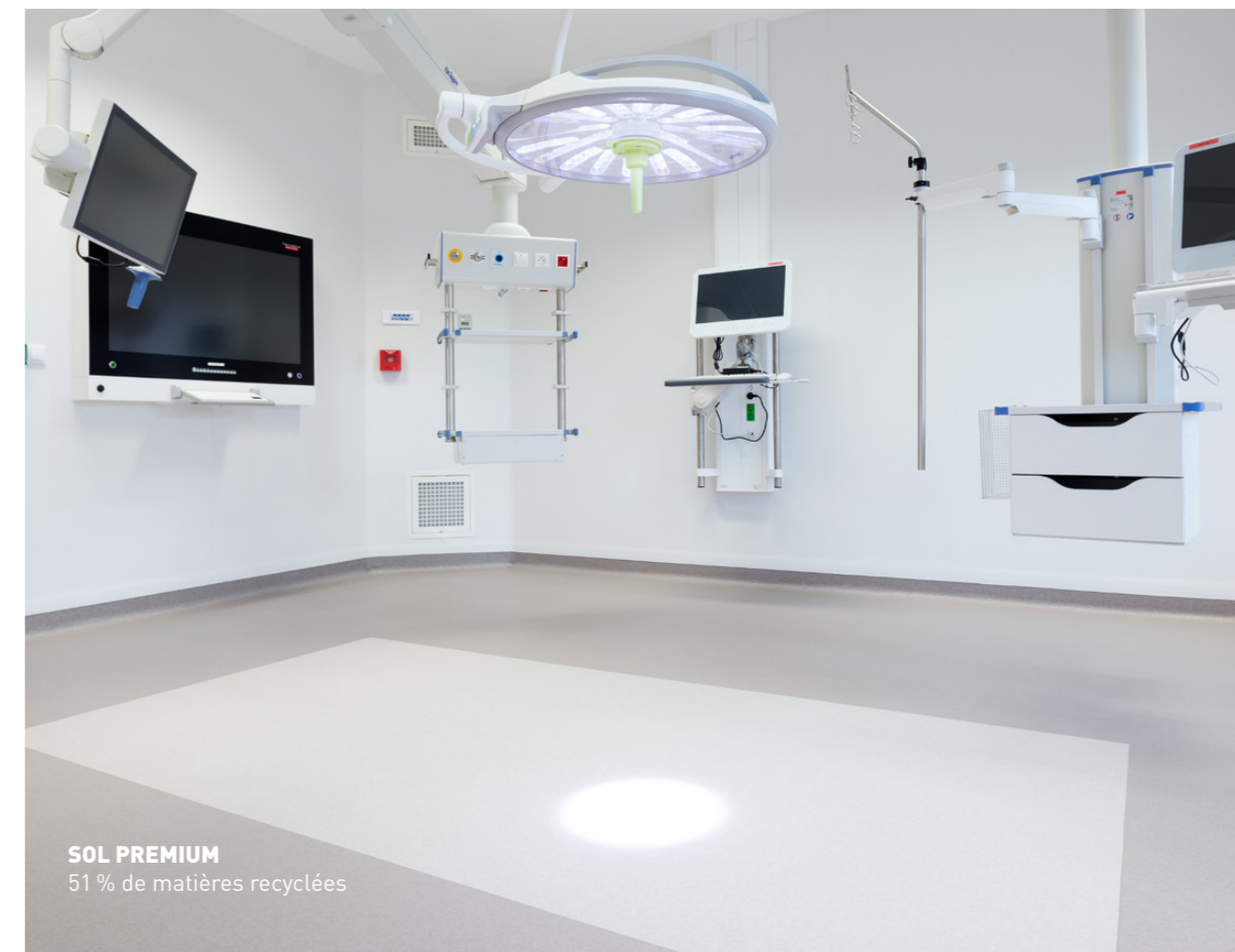
SOL PREMIUM 51 % de matières recyclées