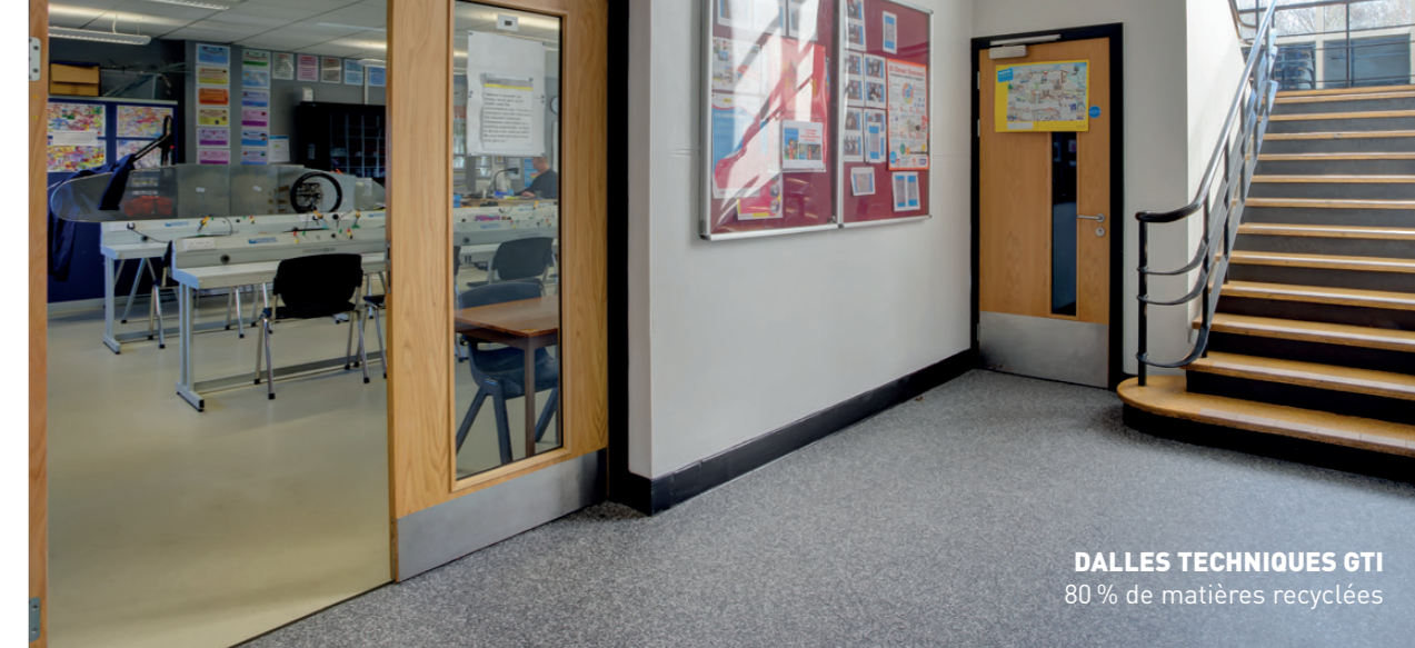
DALLES TECHNIQUES GTI 80 % de matières recyclées