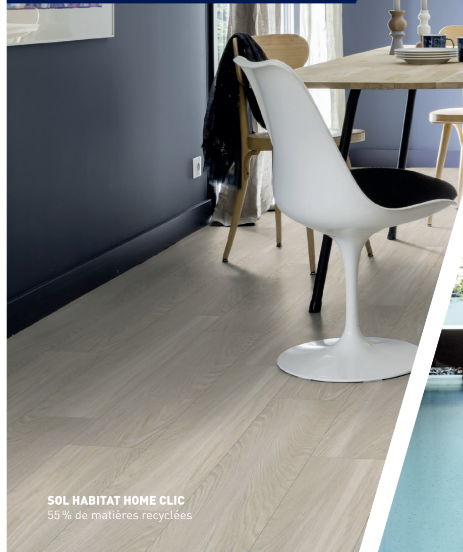
SOL HABITAT HOME CLIC 55 % de matières recyclées

Toutes les chutes collectées dans le cadre du programme Seconde Vie sont intégrées dans nos usines françaises pour la fabrication de revêtements de sol GERFLOR.