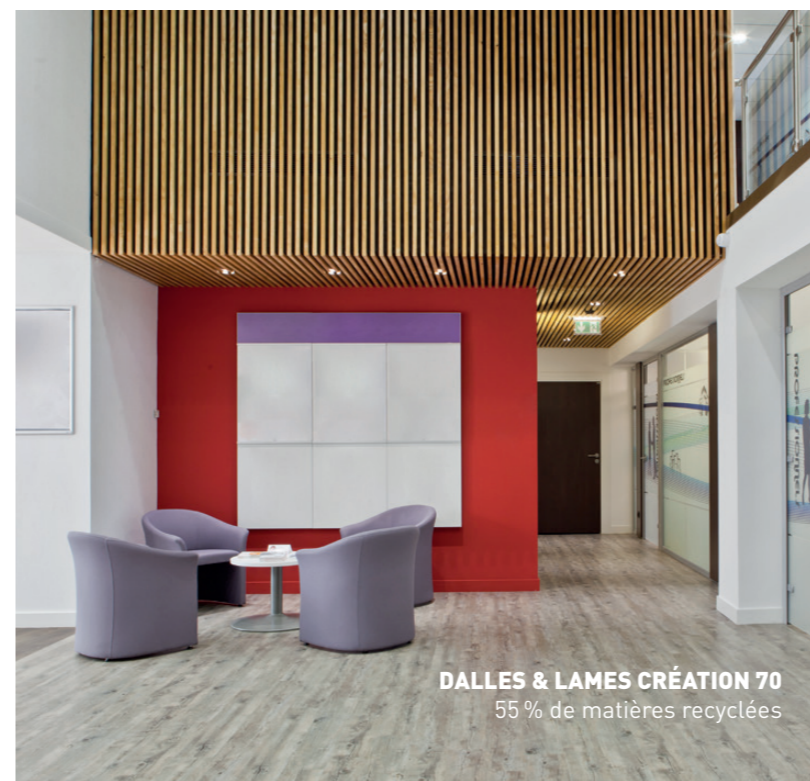
DALLES & LAMES CRÉATION 70 55 % de matières recyclées