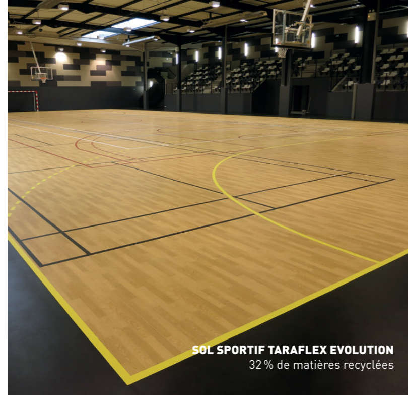
SOL SPORTIF TARAFLEX EVOLUTION 32 % de matières recyclées