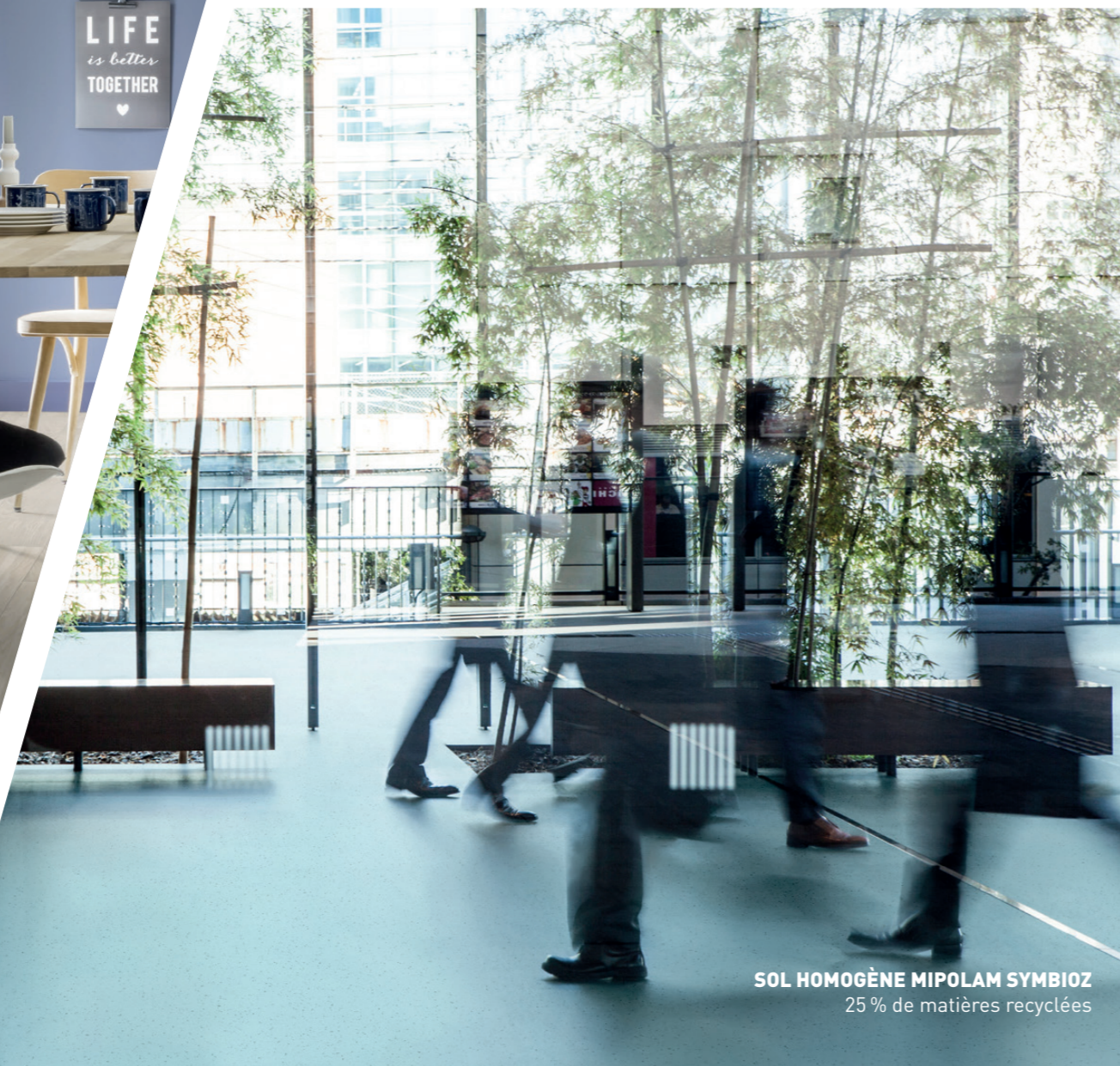
SOL HOMOGENÈNE MIPOLAM SYMBIOZ 25 % de matières recyclées